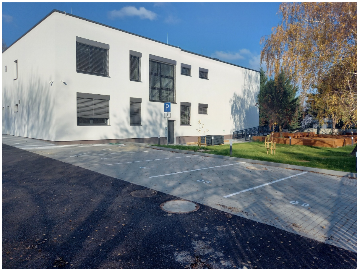
Budova – Račianska 105, Bratislava